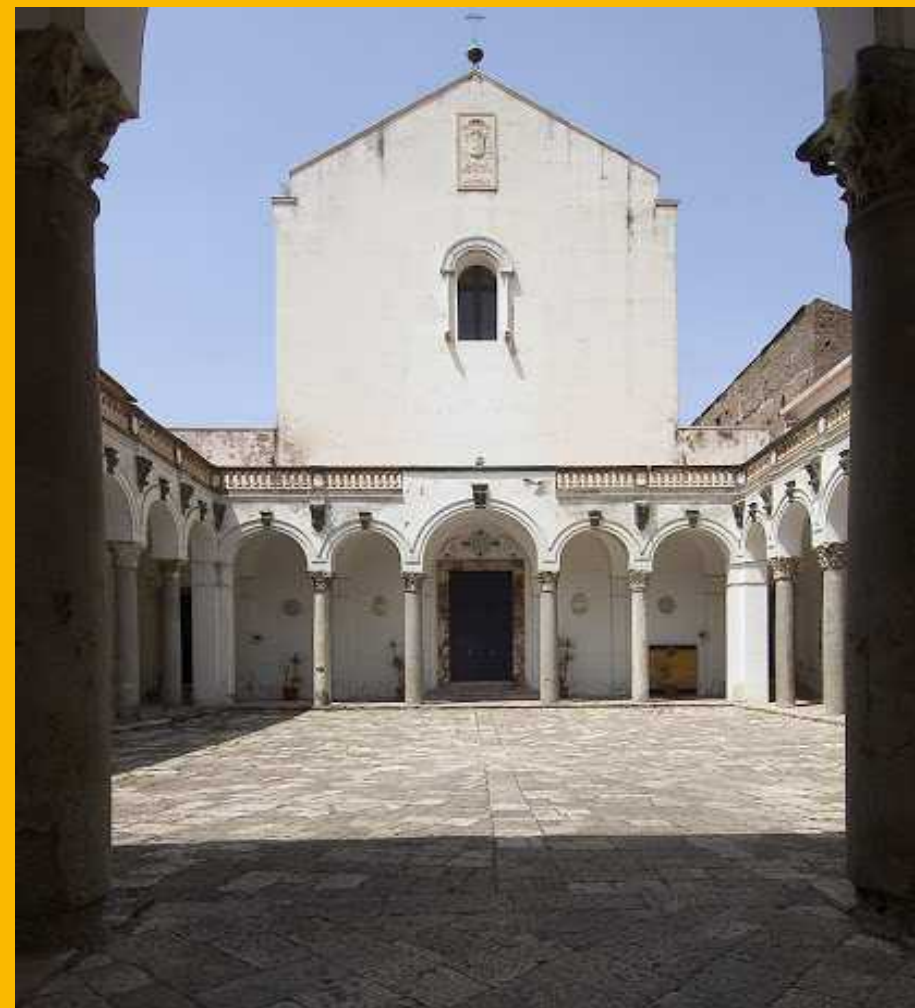
Duomo di Capua