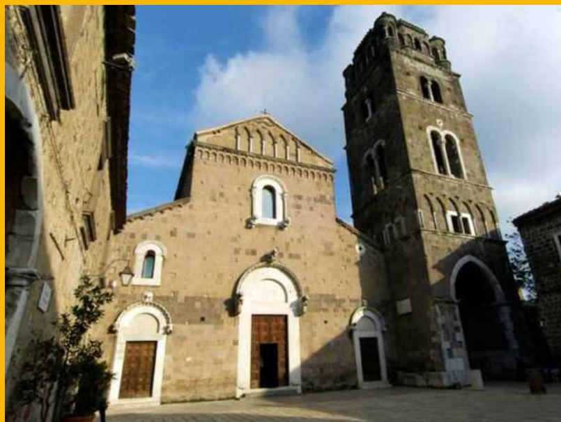
Duomo di Casertavecchia

Non è stato l'unico anno in cui abbiamo partecipato al FAI